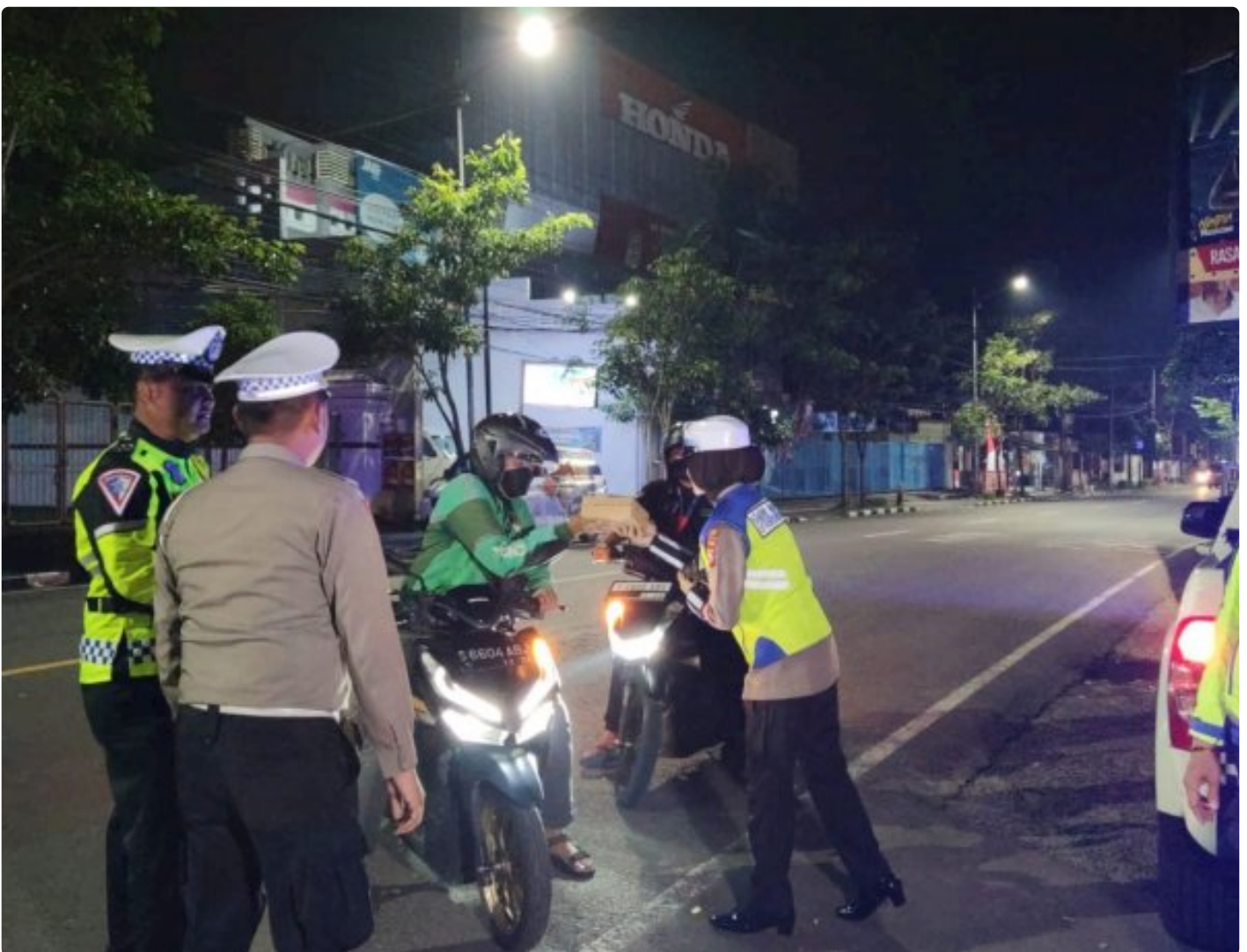
Satlantas Polres Bojonegoro membagikan makanan sahur ke pengguna jalan

BOJONEGORO - Satuan Lalu Lintas (Satlantas) Polres Bojonegoro kembali melaksanakan bakti sosial dengan membagikan makanan sahur kepada warga masyarakat yang membutuhkan, Senin (25/3/2024) dini hari.